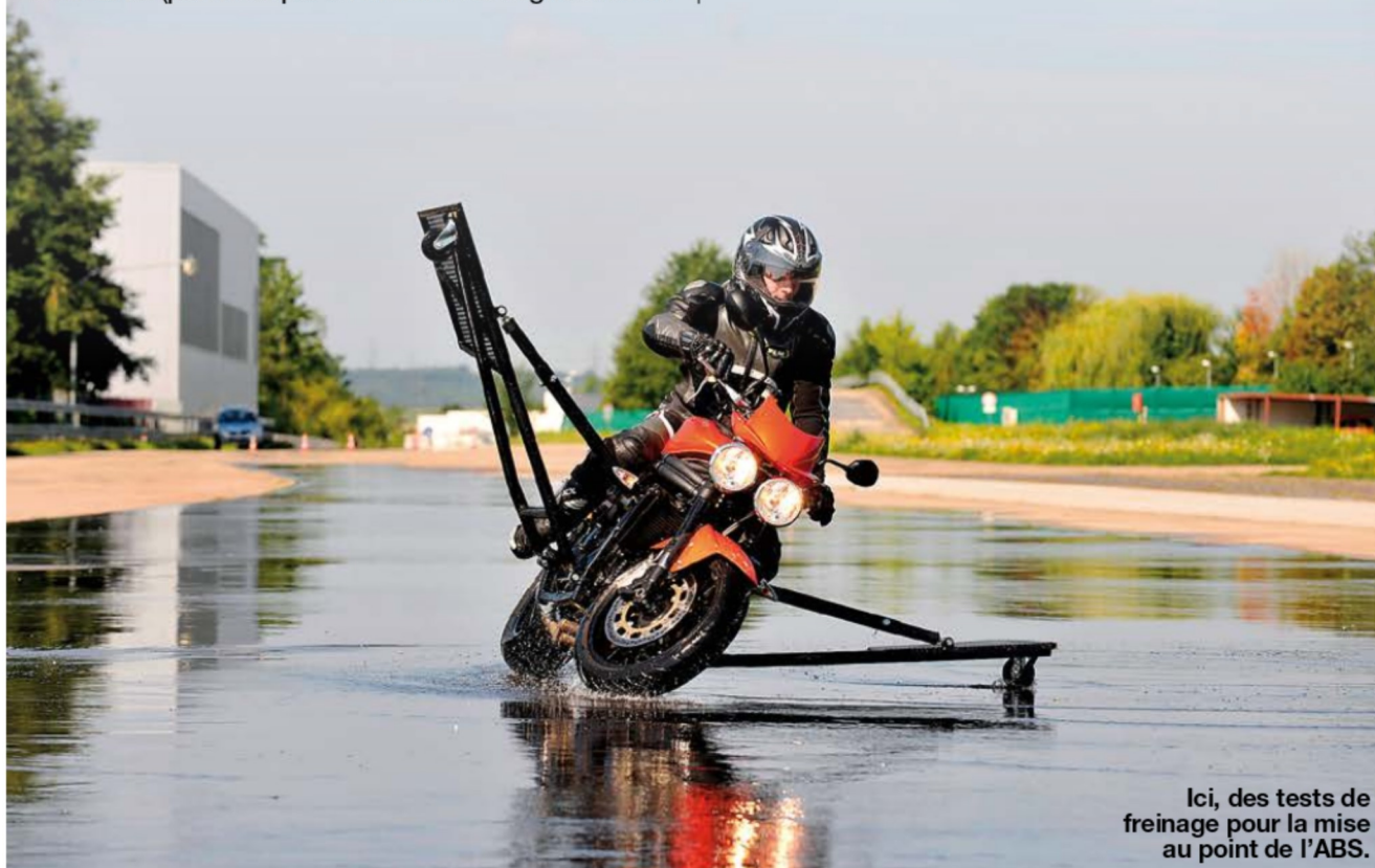
Ici, des tests de freinage pour la mise au point de l'ABS.

La FFMC rappelle que les causes principales des accidents sont avant tout comportementales. Si la technologie peut rattraper ou atténuer une faute de conduite, elle ne peut pas empêcher la faute initiale, l'erreur de jugement, l'inattention ou l'excès de confiance.